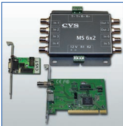
Рис. 2. Системы CVS_MS 6x2/ CVS_MS 6x2N

ны с повышенными требованиями к скорости записи и качеству записываемых видеоизображений.