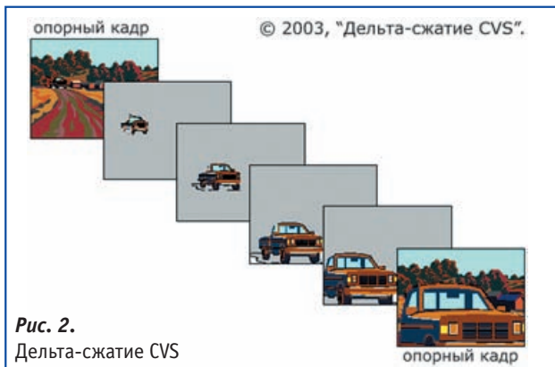
Рис. 2. Дельта-сжатие CVS