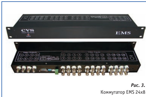
Рис. 3. Коммутатор EMS 24x8

❖ Детектор CVS обладает предельно высокой чувствительностью 1-3%, что явилось результатом применения автоматической коррекции порога отсечки по шумам и компенсации изменения освещенности.