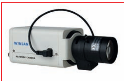
■ IP-видеокамера WL480-C

мые помещения, охрана периметра, гаражи, паркинги, автомобильные стоянки, автотрассы); объекты с необходимостью повышенной детализации изображения (аэропорты, вокзалы, торговые центры).