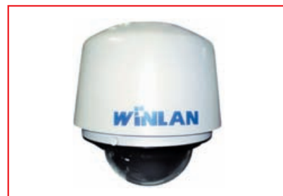
■ IP-видеокамера WL480SD22-C

представлено камерой WL1600/1200-C в стандартном корпусе и купольной камерой WL1600/1200DP-C. Камеры рекомендованы к применению на особо ответственных объектах с необходимостью повышенной детализации получаемого изображения. С их помощью реализуются проекты видеонаблюдения в местах с высокой проходимостью: вокзалы, аэропорты, торговые центры. Камеры WINLAN высокого разрешения предназначены для использования в дневное или ночное время, оснащены слотом для SD-карт, купольные камеры поддерживают стандарт питания по сетевому кабелю.