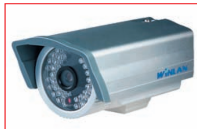
■ IP-видеокамера WL535IR3-C