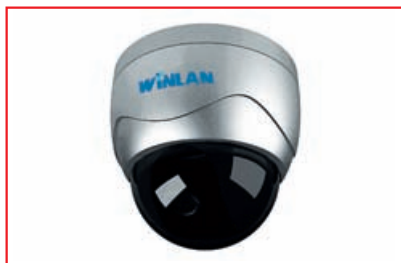
■ IP-видеокамера WL1600-1200DP-C

IP-камера WL535IR3-C оснащена ИК-подсветкой с дальностью действия до 30 м. Данное преимущество позволяет вести на-