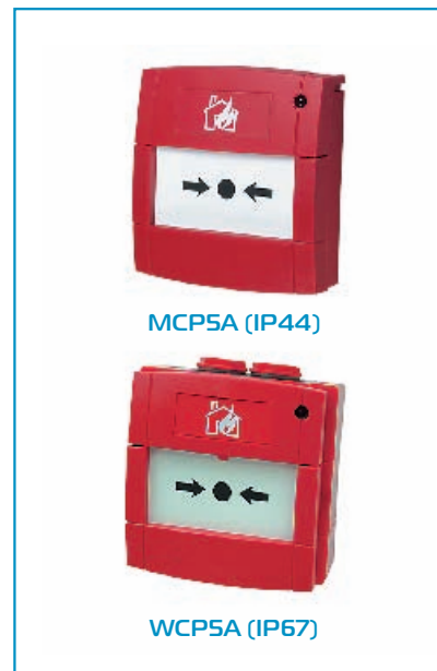
Рис. 3. Адресные ручные извещатели

Все модули 200-й серии (рис. 4) имеют встроенный изолятор короткого замыкания, который при необходимости можно отключить. В новом протоколе 200AP многоканальные модули занимают только один адрес. Так, например, модуль контроля и управления M221E в предыдущей версии