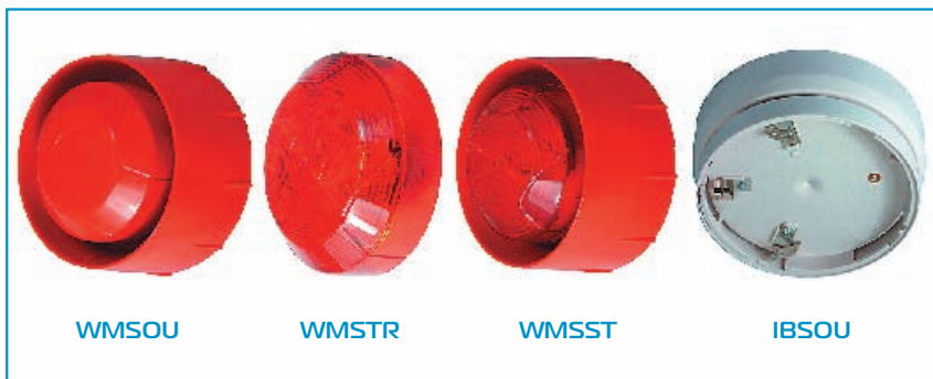
Рис. 2. Оповещатели серии AV

ные: звуковой оповещатель IBSOU и комбинированный IBSST для установки с извещателями как предыдущей 200-й серии, так и с новой серией Caravaggio. В зависимости от условий эксплуатации выбирается тип базы, обеспечивающей требуемый уровень защиты оболочки: IP33 – с базой LPB, IP55 – с базой SMB, IP65 – с базой WB. При помощи механизма субадресации, реализованном в новом протоколе обмена 200AP, теперь можно раздельно управлять каналами комбинированных оповещателей и производить синхронизацию оповещателей по адресной петле.