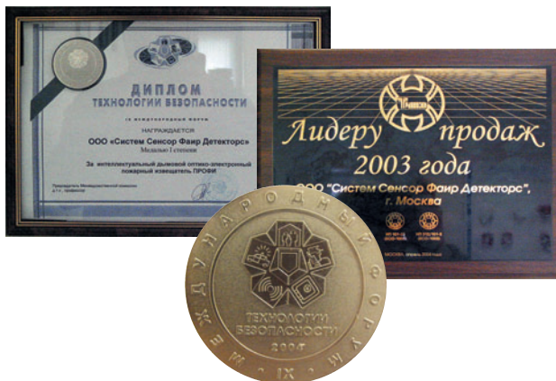
Награды международных выставок

говые пожарные извещатели, неоценима их заслуга в популяризации преимуществ адресно-аналоговых систем в России – самых эффективных для обнаружения сверххранного возгорания.