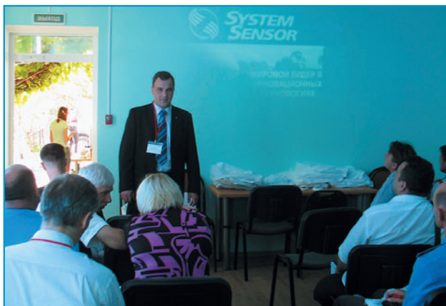
Компания постоянно проводит обучающие семинары

тем. Начиная с 2010 года, извещатели серии Sagavaggio производятся в России.