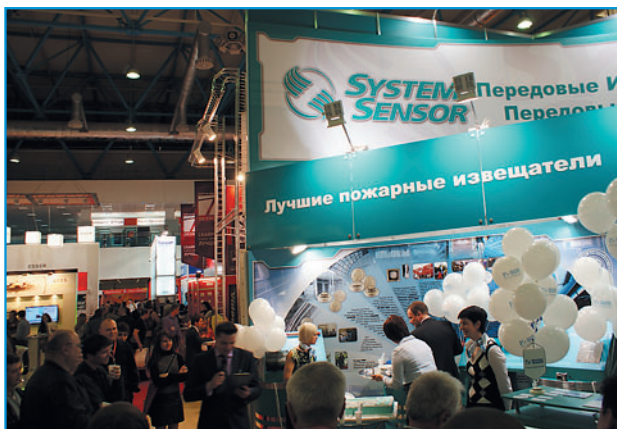
Компания постоянно участвует в специализированных выставках