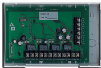
Сетевой контроллер исполнительных устройств СКИУ-02