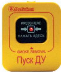
ИР-П – извещатель ручной, адресный, исполнение «ПУСК»

e-mail: info@sigma-is.ru, www.sigma-is.ru