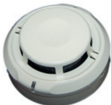
А2ДПИ – адресно-аналоговый дымовой пожарный извещатель