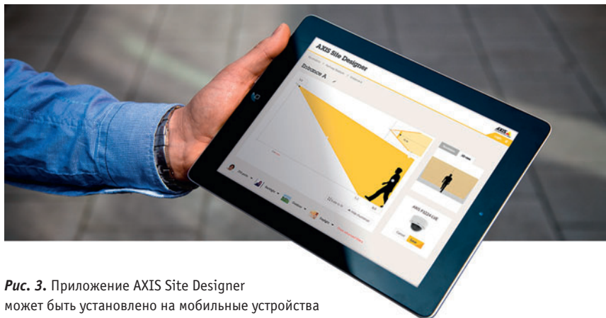
Рис. 3. Приложение AXIS Site Designer может быть установлено на мобильные устройства

С помощью функции Axis Camera View модель SketchUp отображается так, словно ее просматривают через объектив камеры Axis, кроме того, программный модуль дает доступ к широкому спектру крепежных приспособлений Axis. Для завершения проектирования системы программный модуль позволяет просмотреть подробную