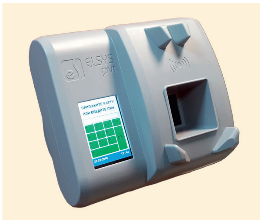
Табл. 1. Технические характеристики биометрического считывателя Elsys-PVR